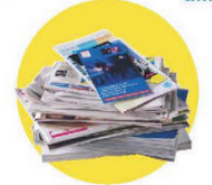
Papiers, journaux, magazines