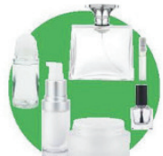
Flacons de cosmétique

(déodorants, pots et flacons, vernis à ongles, parfums...)