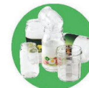
Pots, bocaux, flacons