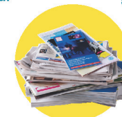
Papiers, journaux, magazines