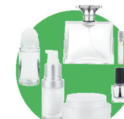
Flacons de cosmétique

(déodorants, pots et flacons, vernis à ongles, parfums...)