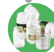
Pots, bocal, flacons