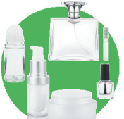
Flacons de cosmétique

(déodorants, pots et flacons, vernis à ongles, parfums...)