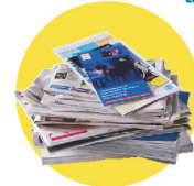
Papiers, journaux, magazines