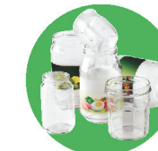
Pots, bouchons, flacons