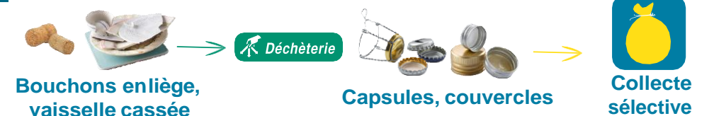
Bouchons en liège, vaisselle cassée