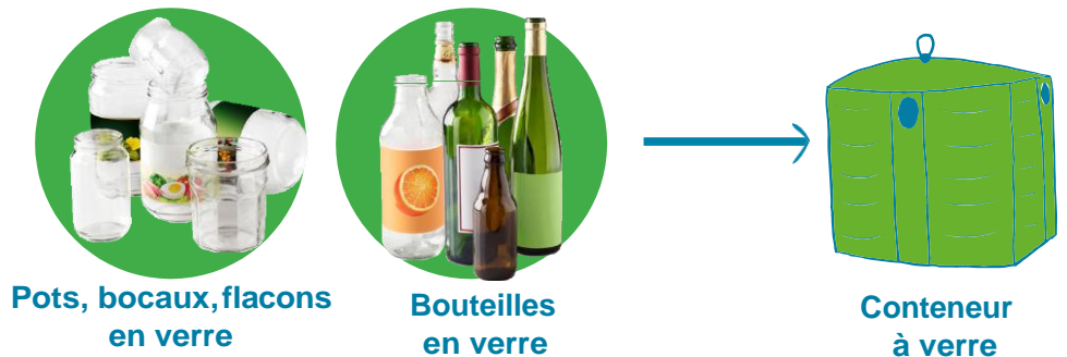
Pots, bocaux, flacons en verre