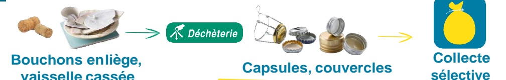
Bouchons en liège, vaisselle cassée