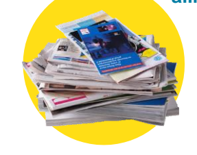
Papiers, journaux, magazines