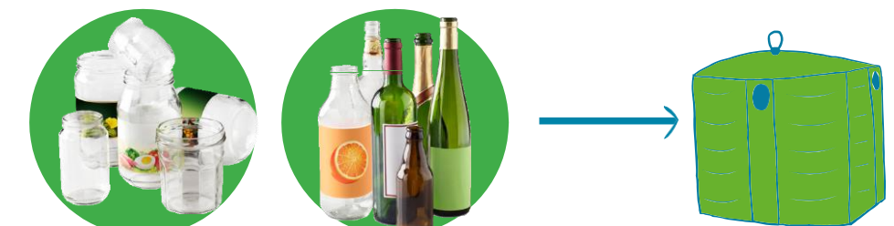
Pots, bocaux, flacons en verre