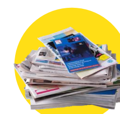
Papiers, journaux, magazines