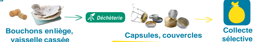
Bouchons en liège, vaisselle cassée