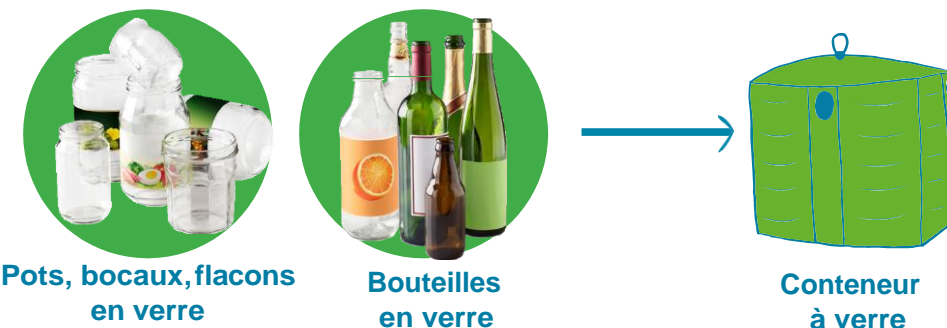
Pots, bocaux, flacons en verre