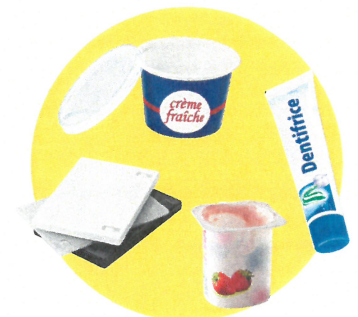
Pots et boîtes