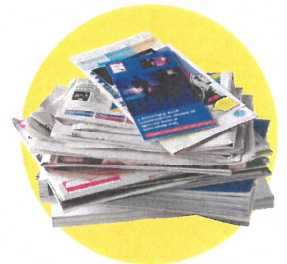
Papiers, journaux, magazines